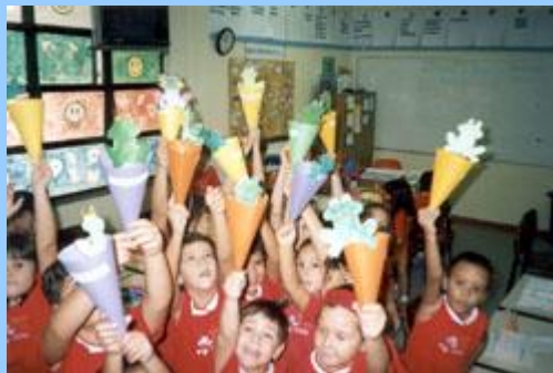
A atividade lúdica serve de apoio à alfabetização.

Cada criança pintou um peixe e criou uma