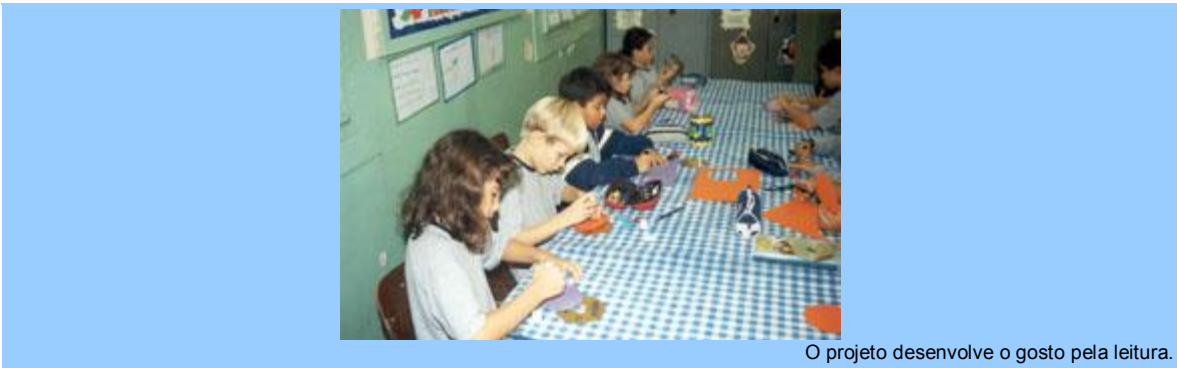
O projeto desenvolve o gosto pela leitura.

Modelando e criando – A professora conta a história e o aluno faz com massa de modelar os personagens, colocando