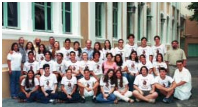
De cima para baixo, as três integrantes da Turma 300, posando para a posteridade: 301, 302 e 303