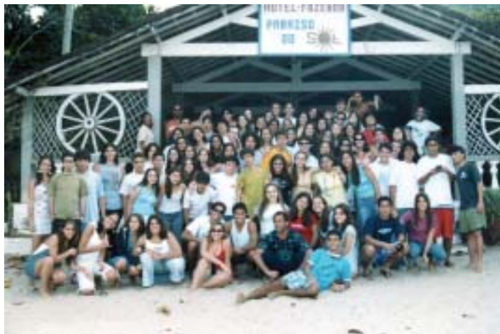
Excursão da Turma 300 à Ilha Grande, entre os dias 2 e 4 de julho de 2004: momento de relaxar

Temos certeza que, dentro de cada um, ficará marcada esta época tão importante, tão básica na formação integral e marcará para sempre os caminhos que irão percorrer. O que desejamos a cada um é uma vida plena de felicidade individual e que esta possa contribuir para o bem-estar comum, onde a ética seja a tônica de sua existência.