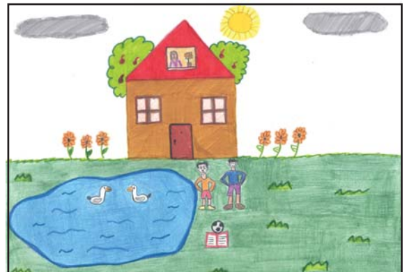
Sérgio Correia de Sá, T. 73