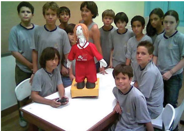
Grupo atual da robótica educativa