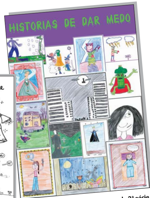
Capa do Livro do Ano da 3ª série

produções textuais, bem como a tipologia textual adotada.