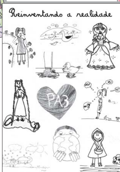
Capa do Livro do Ano da 4ª série

A Oficina Literária, marco inicial do projeto de 2006, ofereceu aos professores a oportunidade de contato com as muitas possibilidades de desenvolvimento do trabalho literário em sala. Dividida em grupos de trabalho, cada série estabeleceu seu roteiro prévio de preparação para as