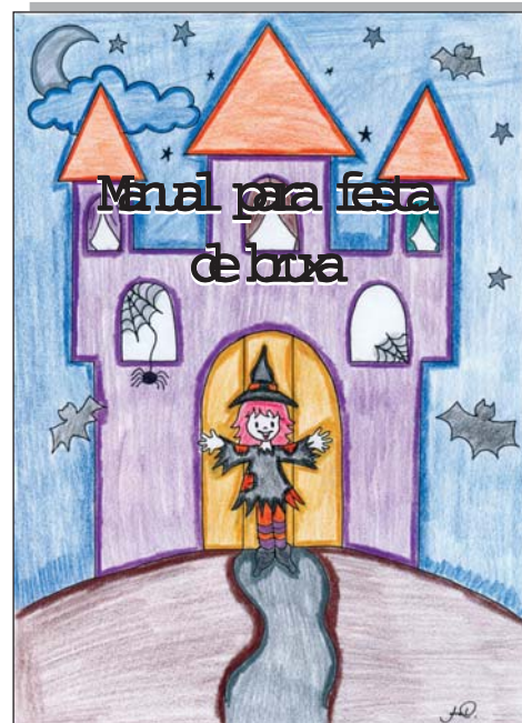
Capa do Livro do Ano da 1ª série