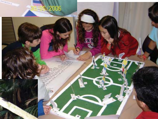
Lernstation 6: Wortschatz - Fußball