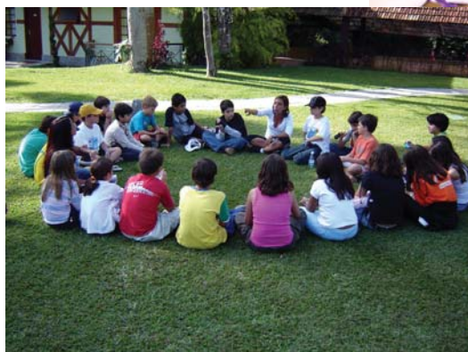
Projekt : “Livro do Ano”