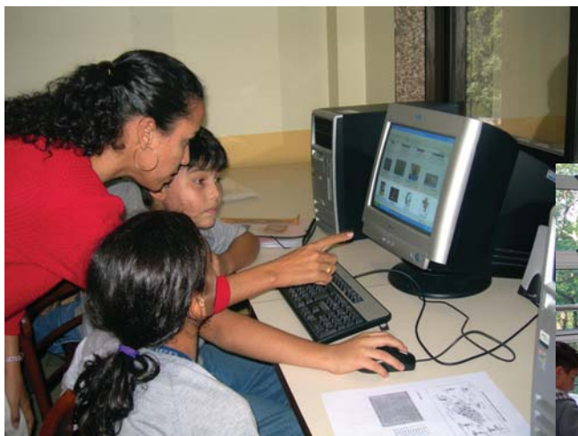
Nas aulas de Inglês, os alunos montaram os times de futebol no computador