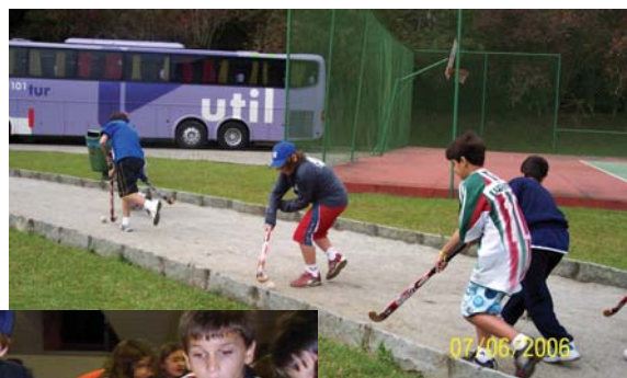
Schüler treiben auch Sport: Hockey