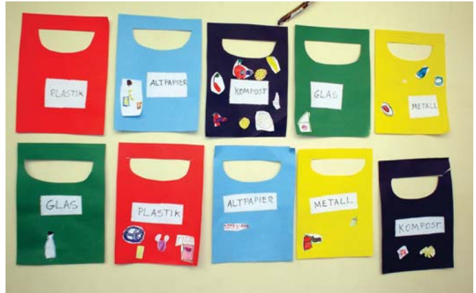
Latas de lixo em cartolina confeccionadas pelos alunos do GIII

Já bastante envolvidas pelo tema, as crianças visitaram o “Cruzeirão”, onde viram e entenderam a função das