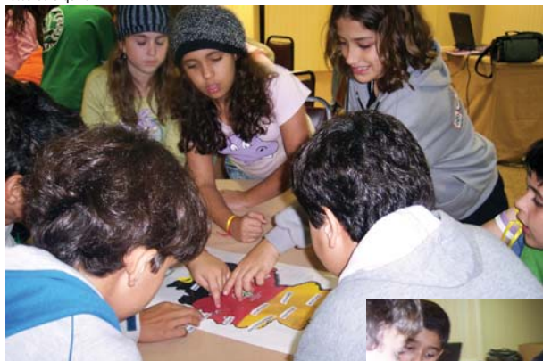
Lernstation 4: WM- Städte in Deutschland