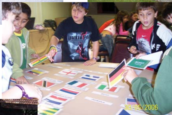
Lernstation 1: Die WM-Länder und ihre Flaggen