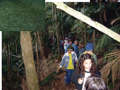
Wanderung im Parque Nacional da Serra dos Orgãos