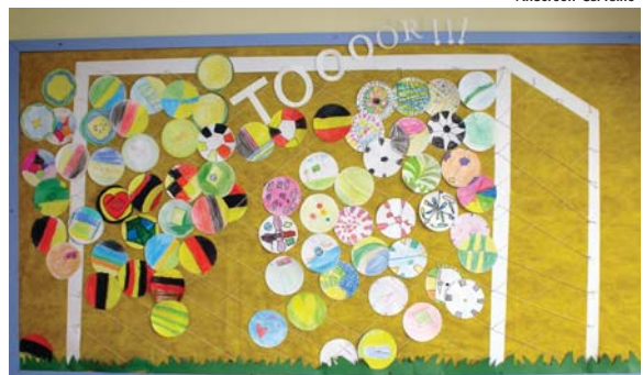
O gol montado pelos alunos foi exposto no Cruzeiroinho