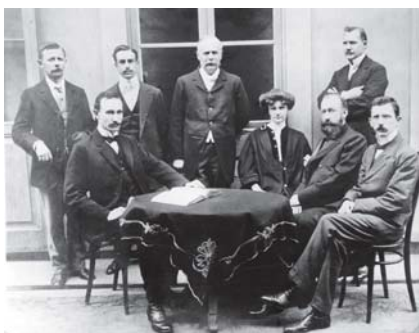
Ao lado, professores na década de 1910. Abaixo, equipe de professores em 1997.

Atualização do corpo docente e sua renovação são fatores que contribuem para que o Colégio Cruzeiro seja uma escola tradicional, sempre à frente do seu tempo, trabalhando para uma formação integral dos seus alunos desde 1862.