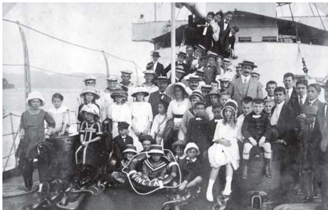
Viagem de alunos e professores em 1912