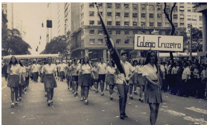
Desfile da Mocidade, na Avenida Rio Branco, em 1970