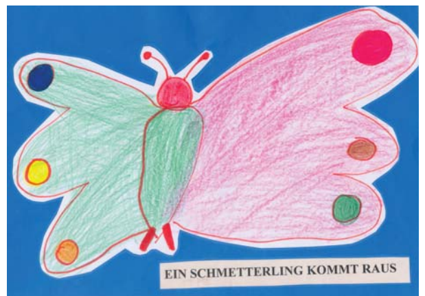
“Uma borboleta sai do casulo”: reprodução das histórias através de desenhos