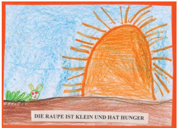
“A lagarta é pequena e está com fome”: ilustração dos alunos do Grupo III