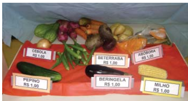
Produtos da Feira Livre montada pelos alunos do Grupo II

No dia 27 de março, cada aluno arrumou sua banca para a Feira Livre, que contou com a participação de todas